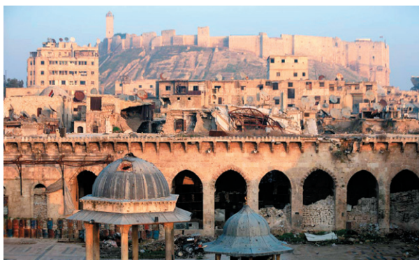
Рис. 3 – Цитадель Алеппо и мечеть Великого Умаяда в старом городе Алеппо, 2017 г. 6

Fig. 2 – One of the statues of Buddhas in Bamyan, destroyed by the Taliban in 2001.