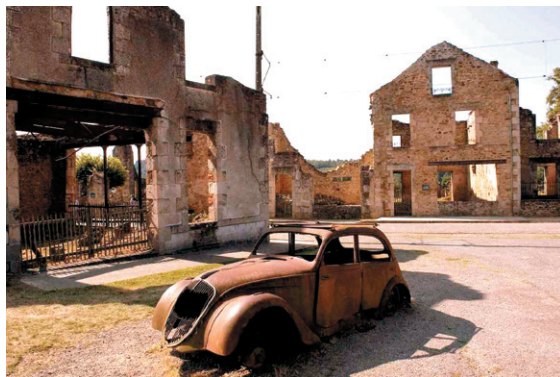
Рис. 1 – Мемориальный центр Орадур-сюр-Глан, Франция 4