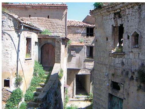
Рис. 4 – Старинный город Токко Каудио, Италия 7

Среди данной группы факторов наиболее существенными с точки зрения отрицательного влияния на физическое состояние объектов культурного наследия являются землетрясения, наводнения, вулканы, температура, влажность, интенсивность и направление ветров, количество дождя и снега, уровень солнечной радиации, а также сезонные различия в погоде (чрезвычайно низкие температуры, высокая влажность и наличие плесени) и др. В качестве примера можно привести старинный город Токко Каудио в Италии, расположенный на