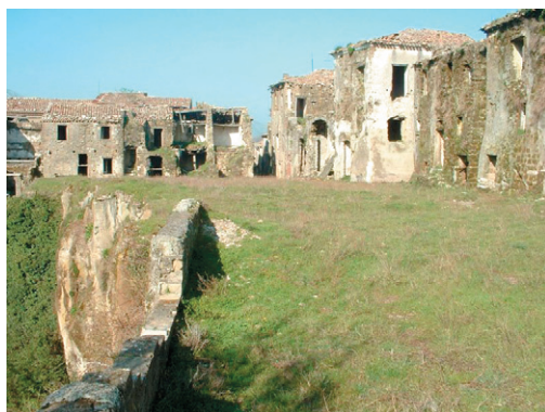
Fig. 4 – Old City Tocco Caudio, Italy