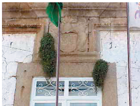
Рис. 5 – Город Браганса, Португалия. Примеры поражения зданий:

а) воздействие плесени, грибков и растительности; б) разрушение структуры строений