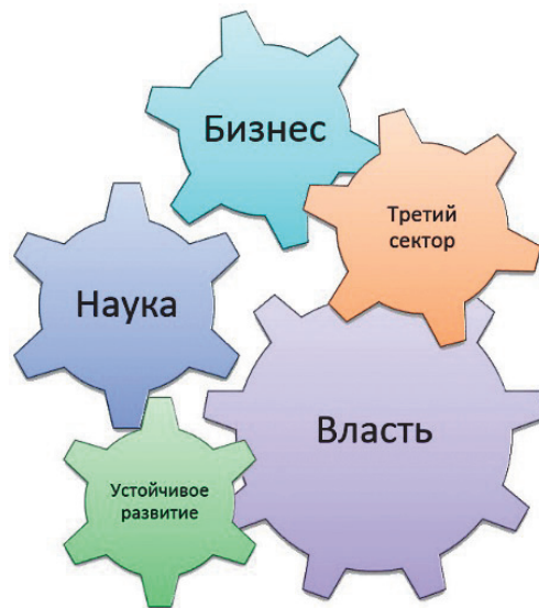
Рис. 6 – Модель механизма обеспечения устойчивого развития исторических городов

устойчивые результаты, чем усилия одного сектора. Частный сектор обычно обладает большим капиталом, гибкостью, эффективностью и специализированными навыками, чем государственный сектор. Участие частного сектора способствует устойчивому экономическому росту, созданию рабочих мест, более устойчивых производственных процессов и технологий, а также повышению корпоративной и социальной ответственности.