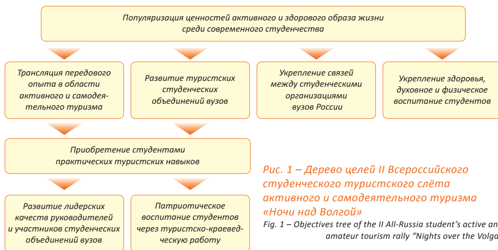
Рис. 1 – Дерево целей II Всероссийского студенческого туристского слёта активного и самостоятельного туризма «Ночи над Волгой»

Мышкинском муниципальном районе. Участниками слёта стали студенты ведущих российских вузов. Рассматриваемое авторами мероприятие проводилось с целью популяризации ценностей активного и здорового образа жизни среди современного студенчества. Для осуществления поставленной цели необходимо было решить ряд подцелей – задач, которые представлены в форме дерева целей на рис. 1.