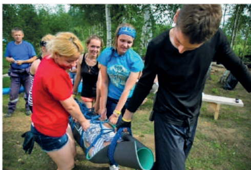
Рис. 3 – Отработка навыков по переносу и транспортировке пострадавшего во время прохождения контрольно-туристского маршрута в рамках слёта

7. Обеспечение культурного досуга студентов в результате просмотра художественного фильма с обсуждением («Кино-Ночь»), проведения интеллектуального шоу «Что? Где? Когда?» на тему активного туризма, а также соревнований по командным видам спорта.