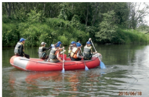
Рис. 7 – Подготовка участников 70-ого Туристского слёта обучающихся образовательных организаций Ярославской области к соревнованиям по рафтингу

5. Формирование сплоченного коллектива посредством временного совместного проживания, работы в команде и ведения туристского быта.