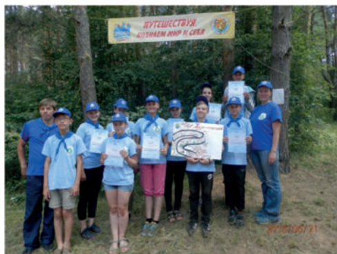
Рис. 6 – Участники 70-го туристского слёта обучающихся образовательных организаций Ярославской области. Команда «Жемчужины Залесья» Муниципальное учреждение дополнительного образования «Станция юных туристов», г. Переславль-Залесский

Fig. 6 – Participants of the 70th tourist rally of training educational organizations of Yaroslavl region. The team «Pearls of Zalesye», Pereslavl-Zalesky