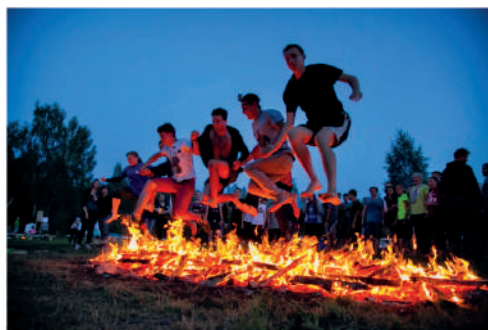
Рис. 4 – Участники вечерней интерактивной программы «Volga Nights»

Fig. 3 – Elaboration of skills for the transfer and transportation of the victim during the passage of the control and tourist route within the framework of the rally