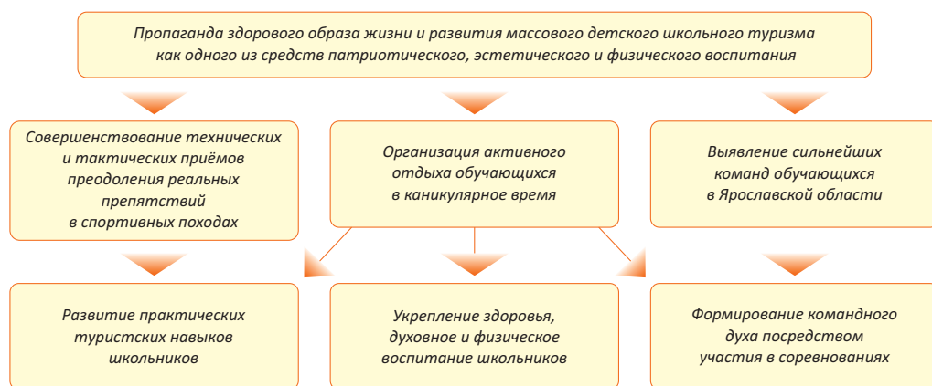
Рис. 5 – Дерево целей Областного профильного неподвижного палаточного лагеря «70-го туристского слёта обучающихся образовательных организаций Ярославской области»

Ярославской области, в составе которых школьники трех различных возрастных групп (1998–2004 г. рождения). Необходимо отметить, что каждую команду возглавлял представитель, назначенный приказом руководителя Образовательной организации и судья от команды для проведения массовых соревнований. Данный слёт проводился с 16 по 22 июня 2016 г. в районе оздоровительного лагеря «Борок» Борисоглебского муниципального района. Областной профильный неподвижный палаточный лагерь «70-ый туристский слёт обучающихся образовательных организаций Ярославской области» 4 проводился в целях пропаганды здорового образа жизни и развития массового детского школьного туризма как одного из средств патриотического, эстетического и физического воспитания. Для реализации поставленной цели необходимо было решить ряд подцелей – задач, которые представлены в форме дерева целей на рис. 5.